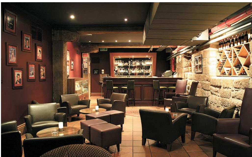
Oben: Zigarrenfreundliche Lokalitäten wie Kingsleys Steakhouse und Cigar Lounge in Sydney sind im Visier der Anti-Raucher-Gesetze Unten: Baranows Zigarrenlounge Up: Cigar friendly venues such as Kingsleys Steakhouse and Cigar Lounge in Sydney are under threat from anti-smoking legislation Down: Baranows Cigar lounge