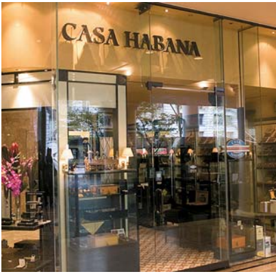
Der Casa Habana-Shop im Grand Hyatt Hotel, Melbourne The Casa Habana cigar divan, located within the Grand Hyatt, Melbourne