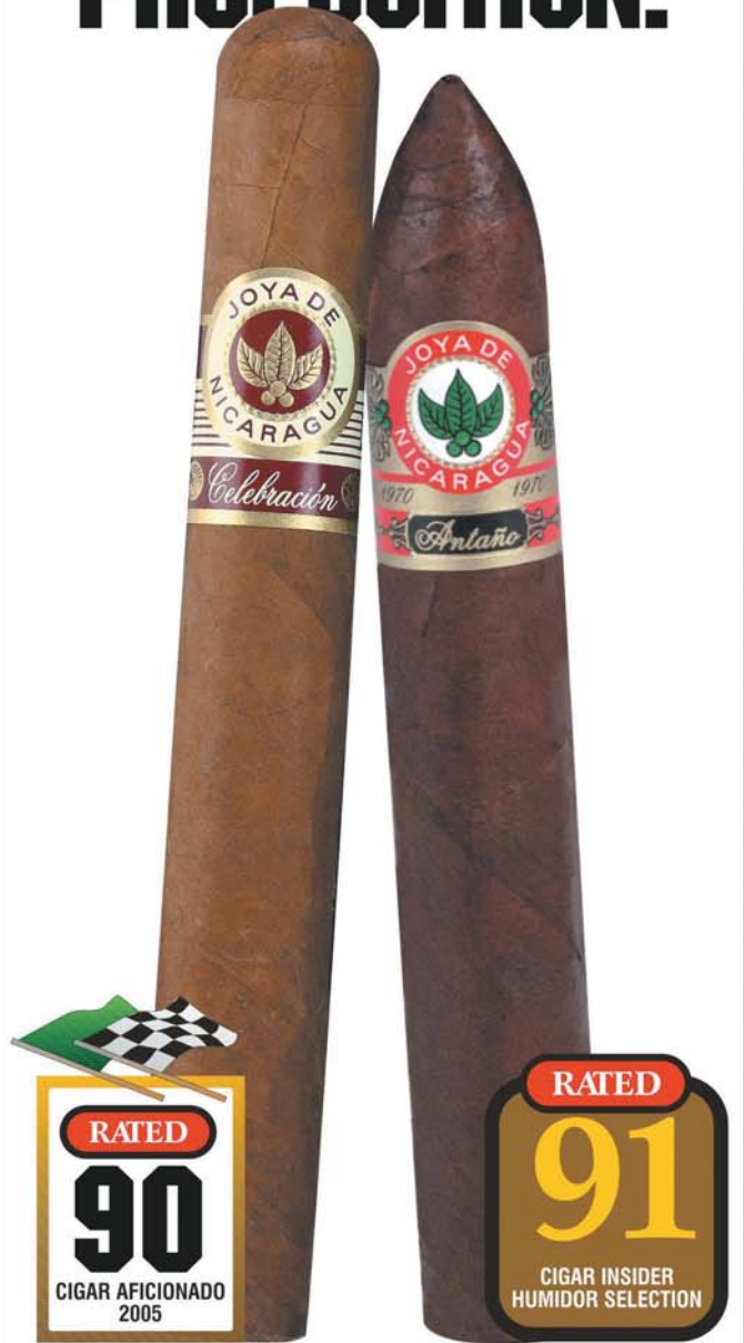
Cigar Aficionado Top 25 Cigars, 2004